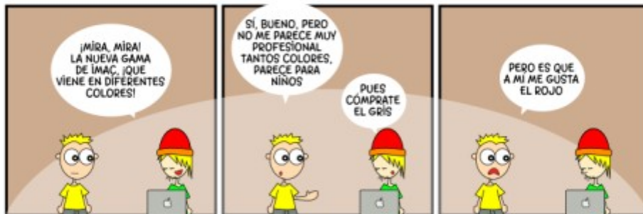
Tira de Linux Hispano