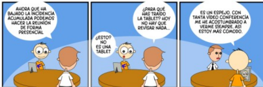
Tira de Linux Hispano