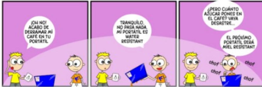
Tira de Linux Hispano